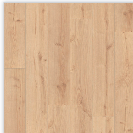
Kolekcja wineo Rock'n'Go, dekor Hotel California, symbol LA144SYSV4. Wymiary [mm]: 1288/195/9. Wzór: pełna deska – rustykalna struktura matowa (wyraźne sęki i wyżłobienia), 4-stronna V-fuga. Cechy: płyta nośna Aqua-Stop, warstwa antystatyczna, klasa ścieralności AC5, montaż bezklejowy Fold-Down.