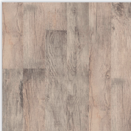
Kolekcja wineo 500 medium, dekor Storm Oak, symbol LA021M. Wymiary [mm]: 1288/195/8. Wzór: 2-deska – struktura surowo-piłowana. Cechy: płyta nośna Aqua Protect, warstwa antystatyczna, klasa ścieralności AC4, montaż bezklejowy LocTec, kolekcja dostępna z podklejonym systemem akustycznym Sound Protect.