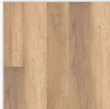
Kolekcja wineo 500 small V4, dekor Welsh Pale Oak, symbol LA008SV4. Wymiary [mm]: 1380/160/8. Wzór: pełna deska – struktura surowo-piłowana, 4-stronna V-fuga. Cechy: płyta nośna Aqua Protect, warstwa antystatyczna, klasa ścieralności AC4, montaż bezklejowy LocTec.