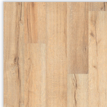
Kolekcja wineo 500 small V4, dekor Tirol Oak Cream, symbol LA043SV4. Wymiary [mm]: 1380/160/8. Wzór: pełna deska – powierzchnia Synchron (wyraźne sęki i wyżłobienia), 4-stronna V-fuga. Cechy: płyta nośna Aqua Protect, warstwa antystatyczna, klasa ścieralności AC4, montaż bezklejowy LocTec.