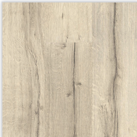
Kolekcja wineo 500 medium V2, dekor Tirol Oak White, symbol LA046MV2. Wymiary [mm]: 1288/195/8. Wzór: pełna deska – rustykalna struktura matowa. Cechy: płyta nośna Aqua Protect, warstwa antystatyczna, klasa ścieralności AC4, montaż bezklejowy LocTec.