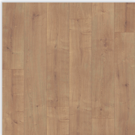
Kolekcja wineo Rock'n'Go, dekor Here Comes The Sun, symbol LA145SYSV4. Wymiary [mm]: 1288/195/9. Wzór: pełna deska – rustykalna struktura matowa (wyraźne sęki i wyżłobienia), 4-stronna V-fuga. Cechy: płyta nośna Aqua-Stop, warstwa antystatyczna, klasa ścieralności AC5, montaż bezklejowy Fold-Down.