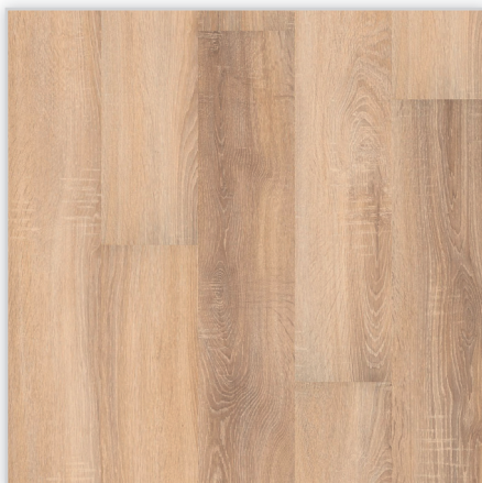
Kolekcja wineo 500 XLV4, dekor Traditional Oak Brown, symbol LA024XLV4. Wymiary [mm]: 1845/195/10. Wzór: pełna deska – struktura surowo-piłowana, 4-stronna V-fuga. Cechy: płyta nośna Aqua Protect, warstwa antystatyczna, klasa ścieralności AC4, montaż bezklejowy LocTec.